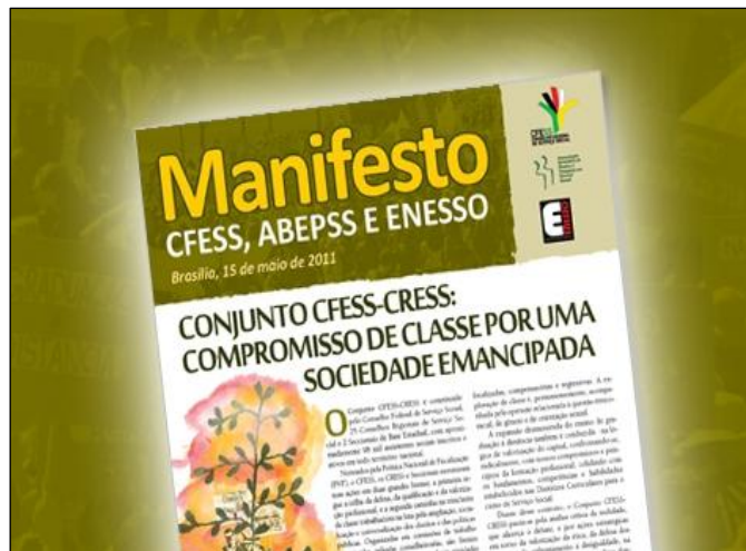
(Manifesto CFESS, ABEPSS e ENESSO. Em: maio de 2011.)

No dia 15 de maio de 2011, dia do assistente social, as entidades representativas da categoria – CFESS-CRESS, ABEPSS e ENESSO – lançaram um manifesto em conjunto, reverenciando o serviço social pela sua dimensão política de compromisso de classe com uma sociedade emancipada. Considerando o debate da emancipação na contemporaneidade, sobre as respostas às expressões da “questão social”, analise as afirmativas a seguir.